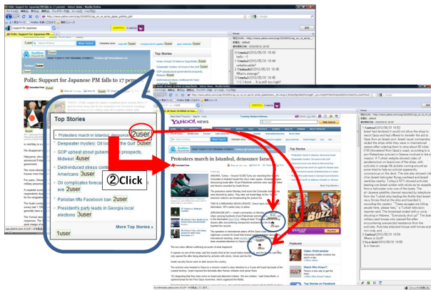
図 2: コミュニケーション画面

コミュニケーション機能が開始されるとライブ閲覧者のキャラクタと右に会話用ウィンドウが表示される。会話用ウィンドウ下部の入力フォームを用いることで、同一ページの閲覧者に対して発話できる。Web ブラウジングの合間にページ内の不明な点の問い合わせや、気楽なコミュニケーションができる。発言内容はサーバの発話ログ内に格納され、時間を跨いで参照可能である。